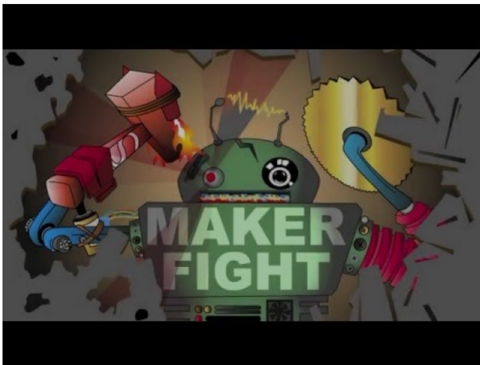
Bande annonce de #Makerfight 2

Toutes les infos sont sur le site internet dédié: http://www.makerfight.fr/