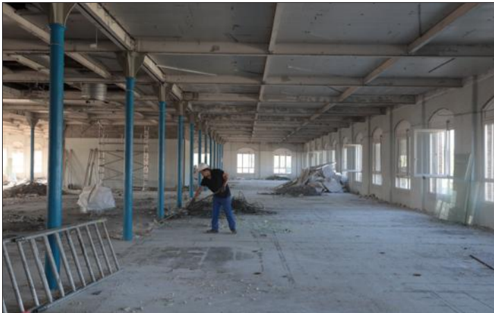
Le plateau du 2 e étage du bâtiment 23 est déjà quasiment à nu. La structure de l'immeuble sera bien sûr préservée, mais l'intérieur sera rénové en profondeur.