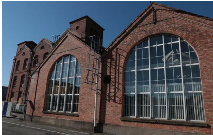
La cité numérique de Mulhouse offrira au total près de 11 000 m 2 de surfaces aux acteurs qu'elle se prépare à accueillir.