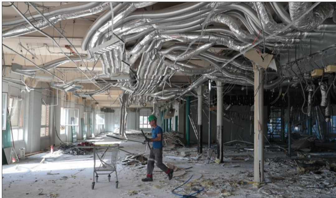
Au premier étage du bâtiment 23, mardi matin. Cloisons et faux plafonds ont déjà été enlevés par l'équipe de Batichoc. Reste à enlever tout un dédale de conduits et de câbles : les anciens locaux de Wärtsilä étaient riches en réseaux divers (chauffage, aération et climatisation, électricité...) !