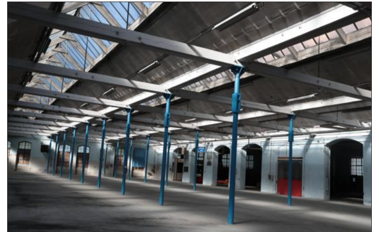
Sur ce vaste plateau sous les sheds (on n'en voit ici qu'une partie), des box seront implantés pour accueillir des start-up. Il y aura aussi un techlab.