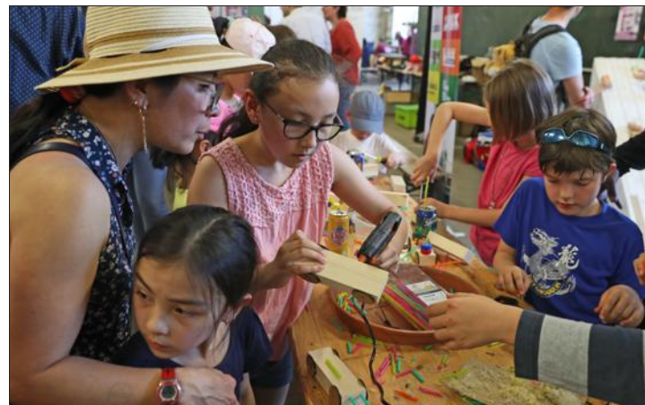
Plus pacifiques, d'autres stands proposaient aux visiteurs de s'initier à l'impression 3D, au pilotage de drones ou à la programmation informatique, ou encore, comme ici, de confectionner des objets.

Ça va vite, en effet. À peine le temps d'une pause buvette, pour avaler un burger mitonné par l'équipe du restaurant Katçup, et voilà de nouvelles têtes d'affiche qui entrent en piste, dont Shark le bien nommé : seule une redoutable disqueuse émerge de cette mignonne boîte métallique couleur bleu GDF. Deux minutes plus tard, son adversaire du jour ressort, déchiqueté, sous les vivats du public. La robotique, finalement c'est tout simple : c'est les jeux du cirque, plus l'électricité.